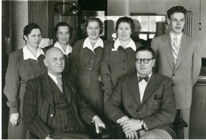
Yhdyspankki, Salon konttori, 2.5.1950.

Yhdyspankissa pankkipukua käytettiin tietävästi 1950-luvulta alkaen. Varhaisista pankkipuvuista on vähän tietoa, mutta tiedossa on, että ensimmäiset puvut olivat työtakkimaisia leninkejä, väriltään sinisiä tai vihreitä. Pankki määräsi mallin sekä hankki ja kustansi kankaan, mutta puvun jokainen teetätti itse.