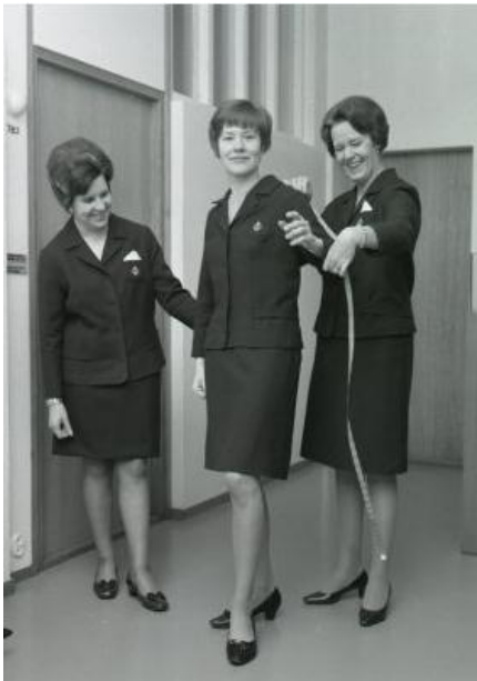
Vuonna 1968 käyttöön otettu tummanvihreä jakkupuku, 2.12.1968.

Ajan myötä pankkipukujen hankinnassa siirryttiin systemaattiseen ja hallittuun valintaprosessiin. Tavoitteena oli valita yhtenäinen ja edustava, pankin imagoon sopiva asu. 1960-luvulta alkaen pankkipukujen yleisin malli oli jakkupuku. Ensimmäiset jakkupuvut olivat hyvin klassisia ja väriltään vihreitä. Jakkupukujen myötä puvut ryhdyttiin tilaamaan suomalaisilta pukutehtailta, joskin 1970-luvulla oli vielä pari pukua, joista pankki tilasi vain kankaat ja puvut teetätettiin ompelijalla.