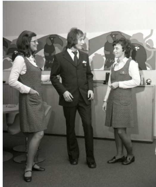
Harmaa liivihame, 20.11.1972.

1970-luvun alussa pankkipukuna oli paljon kritiikkiä saanut harmaa liivihame. Kritiikistä otettiin oppia ja puvun valinnassa alettiin kuunnella käyttäjien antamaa palautetta. Seuraavien pukujen väreissä ei säästely ja vaihtoehtoja oli niin runsaasti, että lopulta palattiin hyvin yhtenäiseen asukokonaisuuteen.