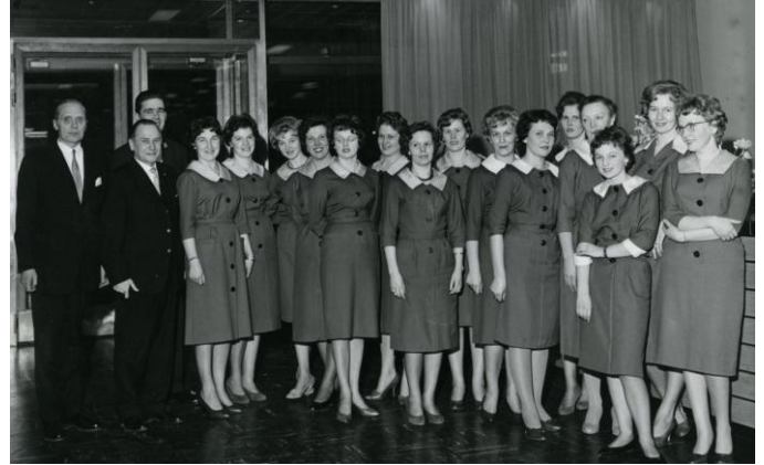
Yhdyspankki, Kokkolan konttori, 1961.

Ajan myötä pankkipukujen hankinnassa siirryttiin systemaattiseen ja hallittuun valintaprosessiin. Tavoitteena oli valita yhtenäinen ja edustava, pankin imagoon sopiva asu. 1960-luvulta alkaen pankkipukujen yleisin malli oli jakkupuku. Ensimmäiset jakkupuvut olivat hyvin klassisia ja väriltään vihreitä. Jakkupukujen myötä puvut ryhdyttiin tilaamaan suomalaisilta pukutehtailta, joskin 1970-luvulla oli vielä pari pukua, joista pankki tilasi vain kankaat ja puvut teetätettiin ompelijalla.